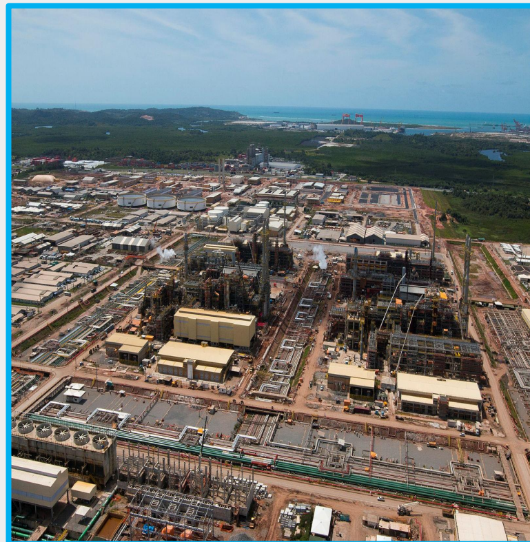
RNEST 10,6 MWp 8,00 MW