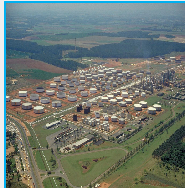
REPLAN 18,0 MWp 13,5 MW