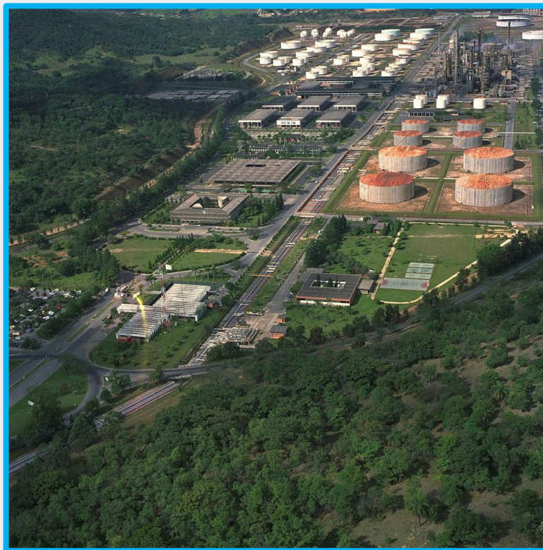
REGAP 13,3 MWp 10,0 MW